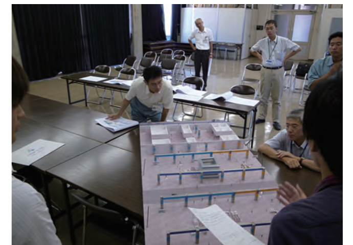
市場でのプレゼン風景