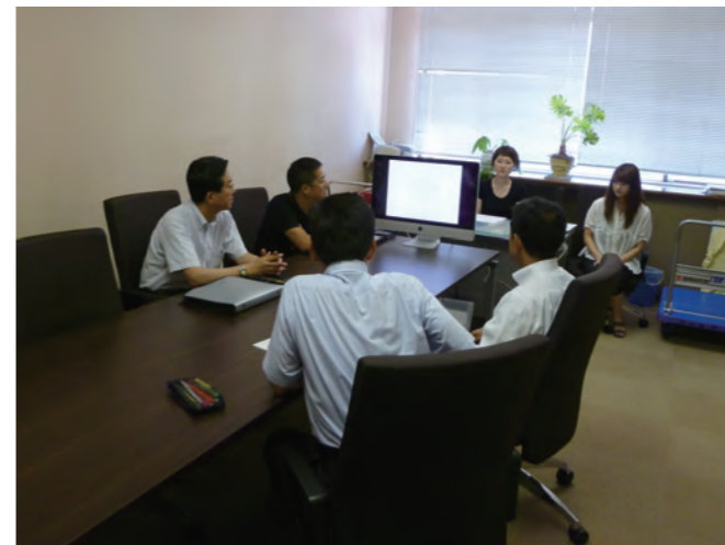
プレゼンテーション