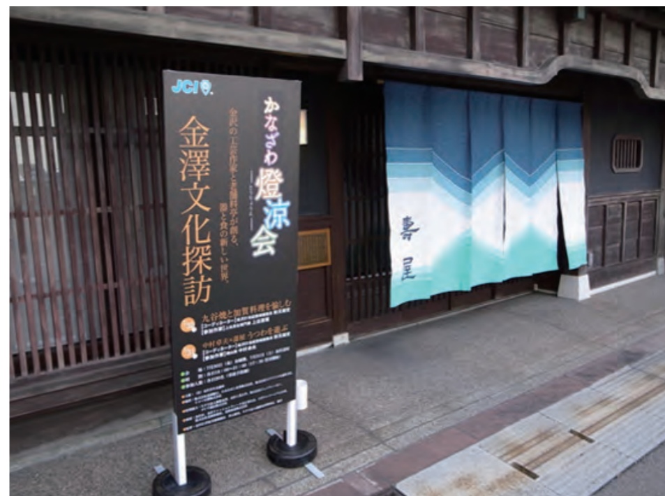
会場となった講屋