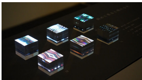
児玉 菜緒 Nao KODAMA