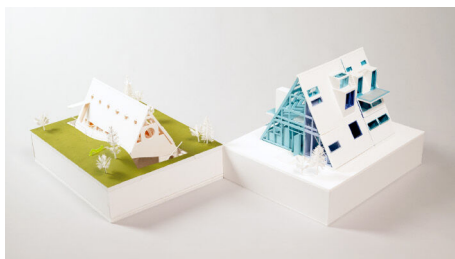
野村 夕月 Yuzuki NOMURA

展示 | 2/14 (Sat) — 2/20 (Fri) 10:00 — 18:00 (最終日 17:00)