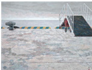
仁志出龍司 「フェリーポートを待つ港」1979年

2013年～2018年度に寄贈、購入した芸術資料を「日本画家仁志出龍司の制作過程」、「工芸特集」など7つの視点でご紹介します。