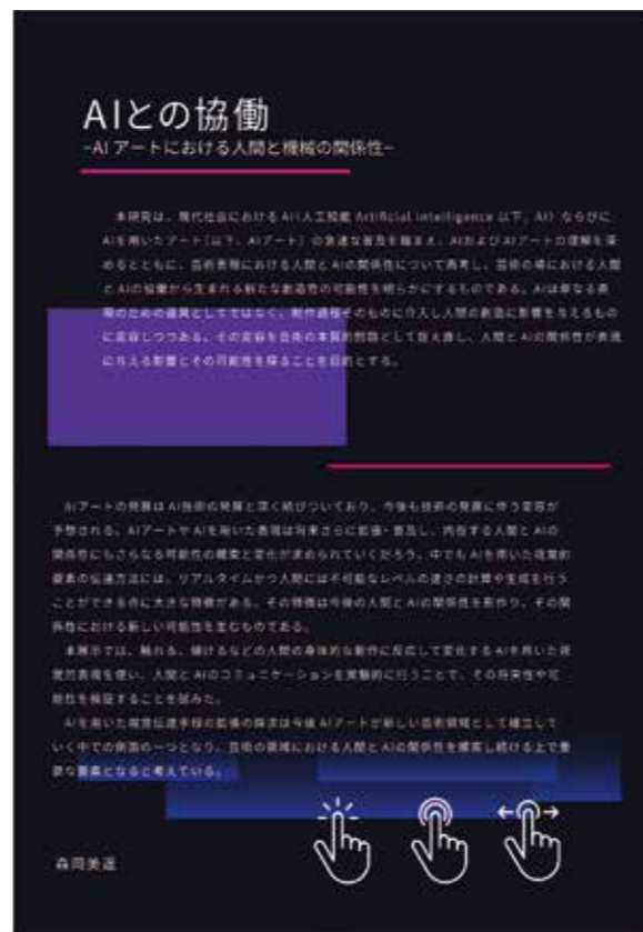
森岡美遥 「AIとの協働 -AIアートにおける人間と機械の関係性-」