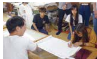
工房見学(毎田染画工芸)