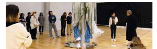
演習(四)卒業研究発表風景