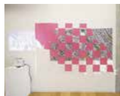
演習(一) グループワーク