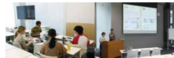
演習(三)ゼミごとの指導風景例