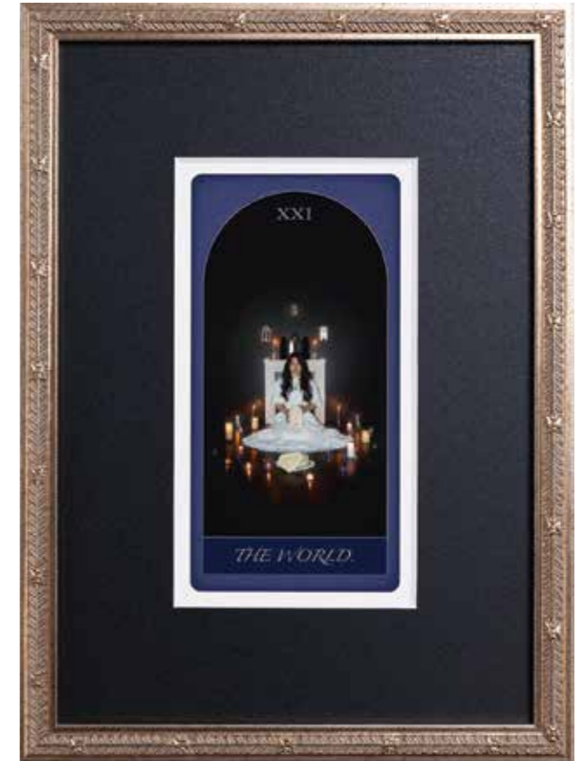
岡田宇左 「Dream Tarot -Trionfi-」 ジークレープリント、Hanemuhle Photo Rag、額装