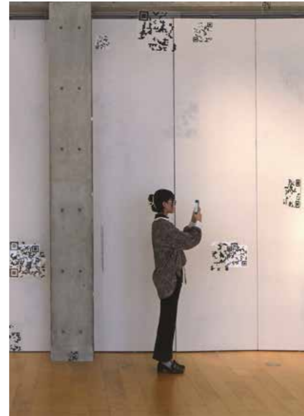
山辺彩音 「カサナリ」 アクリル板、水性スプレー(黒)、プライマー、テグス