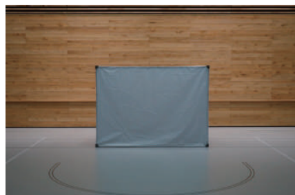
ID 岡本 直也 OKAMOTO Naoya

近代から残り続ける街の様子と時代による変化を踏まえた写真作品 - 外国人の視点から令和日本の風景を記録する -