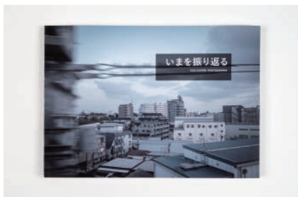
VD 叶 中天 YE Zhongtian

近代から残り続ける街の様子と時代による変化を踏まえた写真作品 - 外国人の視点から令和日本の風景を記録する -