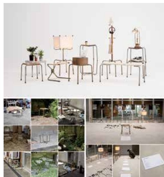
巻野見也 「アップサイクルによる意識の変化」 プロダクトデザイン