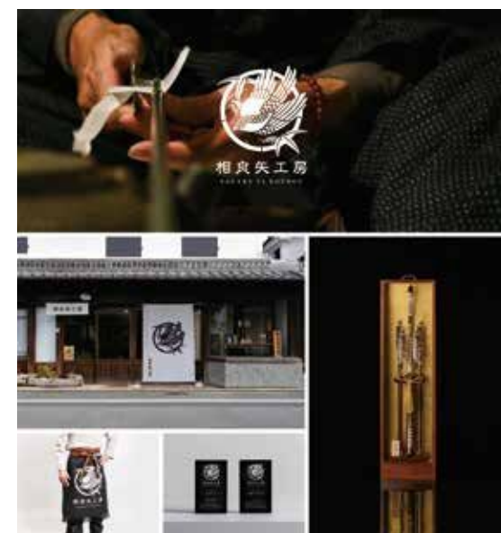
相良実和 「相良矢工房 矢工房のリブランディング」 ブランディング