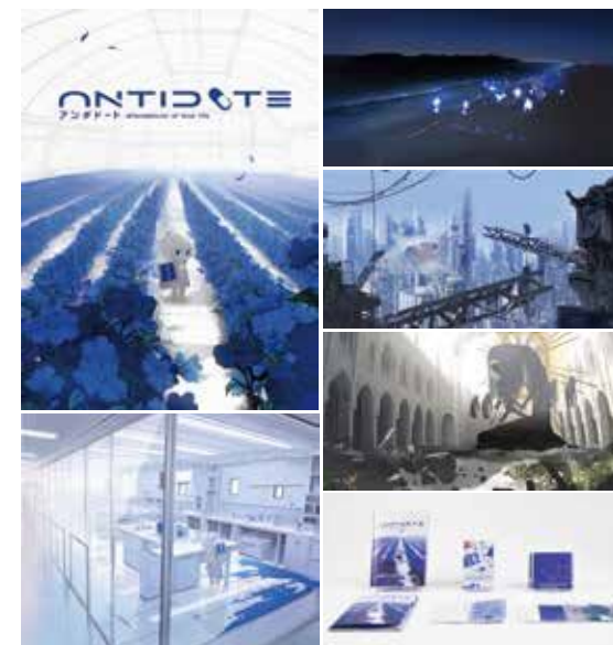
伊藤愛理 「ANTIDOTE 探索型パズルプラットフォームゲーム」 ゲーム企画