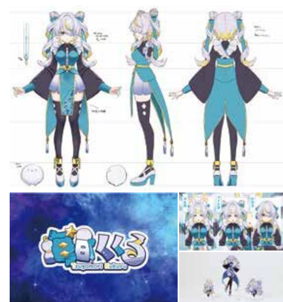
細江美結 「毎日ぐるるProject オリジナルVtuber個人制作プロジェクト」 キャラクター