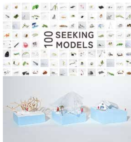
渡部ありさ 「心のなかに伴せにかくまわれている感覚的な痕跡からつくる建築の考察」 建築