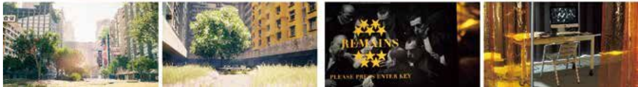
山梨蓮 「フィクションの世界に没入する体験の研究」 インスタレーション