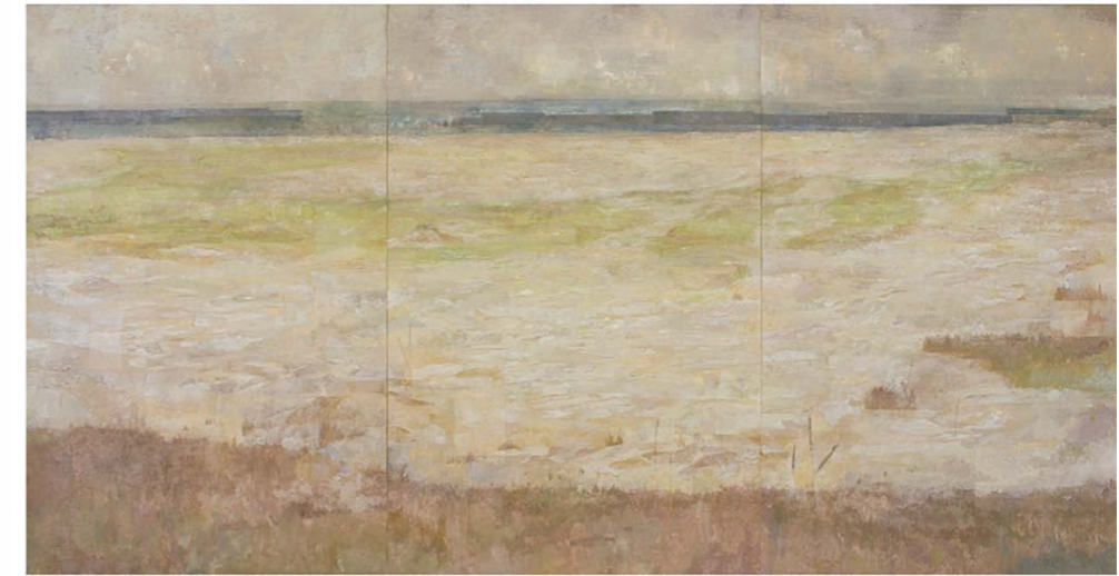
砂浜 乙部 亮 岩絵具、水干絵具、糸、和紙 H147×W283.5 cm