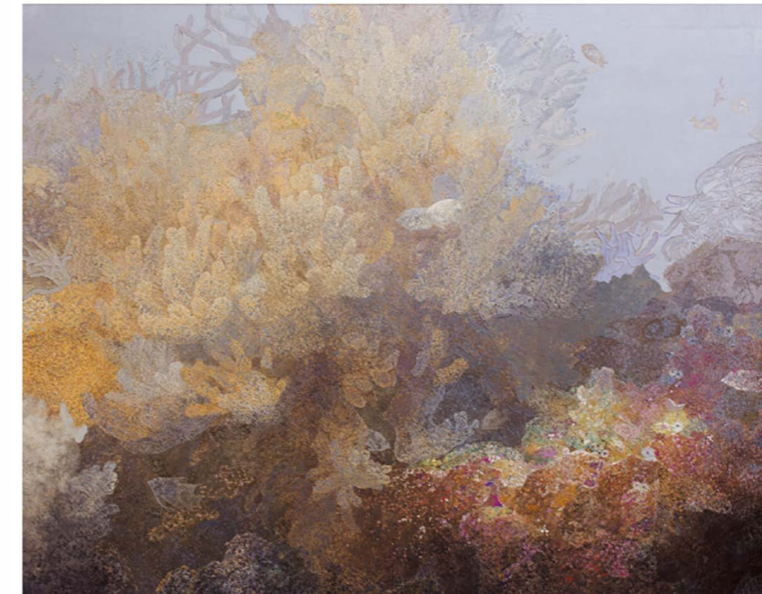
悠々 工藤 彩 岩絵具、水干絵具、箔、和紙 H181.8×W227.3 cm