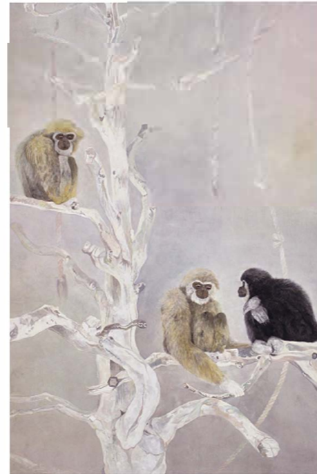
木の上で 川田 実有 岩絵具、水干絵具、和紙 H194×W130.3 cm