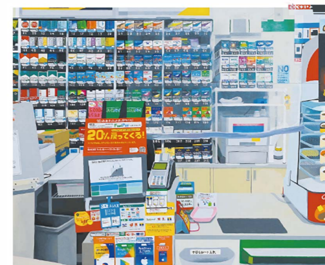
君の好きな歌はたぶん皆好きだよ(部分)パネル アクリル絵具 H133×W162 cm