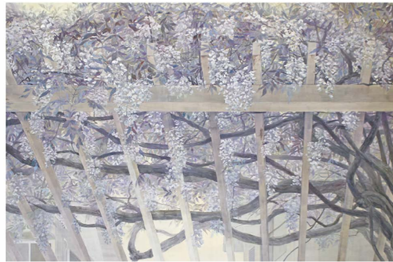
影 森花 岩絵具、水干絵具、和紙 H130.3×W194 cm