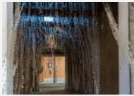
参考作品 「Inner」2023年 GO FOR KOGEI 2023

現在 金沢美術工芸大学大学院 美術工芸研究科 美術領域 彫刻分野 博士在学 2023年 金沢美術工芸大学大学院 美術工芸研究科 工芸専攻 染織コース 修了 1993年 内モンゴル生まれ 2023年 「記憶をほどく、編みなおす」企画展(ギャラリー無量/砺波) 2023年 「GO FOR KOGEI 2023」(岩瀬エリア・沙石/富山) 2023年 「金沢彫刻祭2023」(第一ビル/金沢) 2023年 KANABIクリエイティブ賞2022 卒業・修了制作部門 招聘審査員特別賞 2022年 「工芸2022」(雪梁舎美術館/新潟) 2022年 「輪廻」—033・YULING LIN二人展(アートベース石引/金沢) 2022年 「つながる糸 ひろがる布」(堀川御池ギャラリー/京都) 2022年 「染展」(BE=Lab&Gallery/大阪)