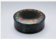
参考作品 「乾漆螺細箱(カタバミ)」2023年

現在 金沢美術工芸大学大学院 美術工芸研究科 工芸領域 漆芸分野 博士在学 2022年 秋田公立美術大学大学院 複合芸術研究科 修了 1996年 中国安徽省生まれ 2023年 薪技芸 国際青年工芸展(吉林芸術学院美術館/長春) 2023年 国際漆展・石川2023 入選 2023年 第63回石川の伝統工芸展 入選 2023年 第15回秋田工芸展 県議会議長賞 2023年 薪技芸 国際青年工芸展 銅賞 2022年 第62回東日本伝統工芸展 入選 2022年 第14回秋田工芸展 秋田県知事賞