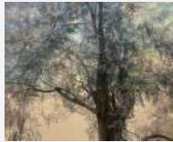
参考作品 「化ける者」2022年

現在 金沢美術工芸大学大学院 美術工芸研究科 美術領域 日本画分野 博士在学 2023年 金沢美術工芸大学大学院 美術工芸研究科 絵画領域 日本画コース 修了 1997年 福岡県生まれ 2023年 「新緑の頃の絵画展」(ギャラリートネリコ/金沢) 2023年 KANABIクリエイティブ賞2022 卒業・修了制作部門 学長賞 2022年 「金美選抜展 in 問屋町」(金沢流通会館) 2022年 第9回改組新日展 入選 2021年 「ふたり展」(金沢 cafe&gallery musee) 2021年 「耀画廊選抜展 一対の世界」(東京九段耀画廊/東京) 2021年 第8回改組新日展 入選 2020年 第7回改組新日展 入選