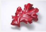
参考作品 「変容するかたち」2023年

現在 金沢美術工芸大学大学院 美術工芸研究科 工芸領域 漆芸分野 博士在学 2023年 金沢美術工芸大学大学院 美術工芸研究科 工芸専攻 漆・木工コース 修了 1996年 中国福建省生まれ 2023年 国際漆展・石川2023 入選 2023年 日本漆工協会 漆工奨学賞 2023年 第79回金沢工芸展 北国新聞社長賞 2023年 KANABIクリエイティブ賞2022 卒業・修了制作部門 学長賞 2022年 第5回金沢・世界工芸ビエンナーレ 入選 2022年 KANABIクリエイティブ賞2021 制作部門 奨励賞 2022年 「かたちをまとう」三人展(中村記念美術館/金沢) 2021年 「工芸2021」(新潟雪梁舎美術館/新潟) 育成賞