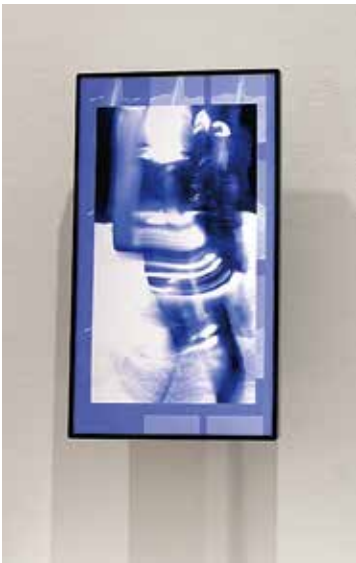
中山航 「Moonwalk (Cyclic)」 2024 映像、XDR