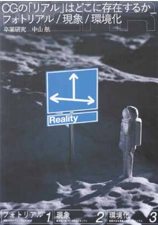
中山航 「CGの「リアル」はどこに存在するか フォトリアル／現象／環境化」