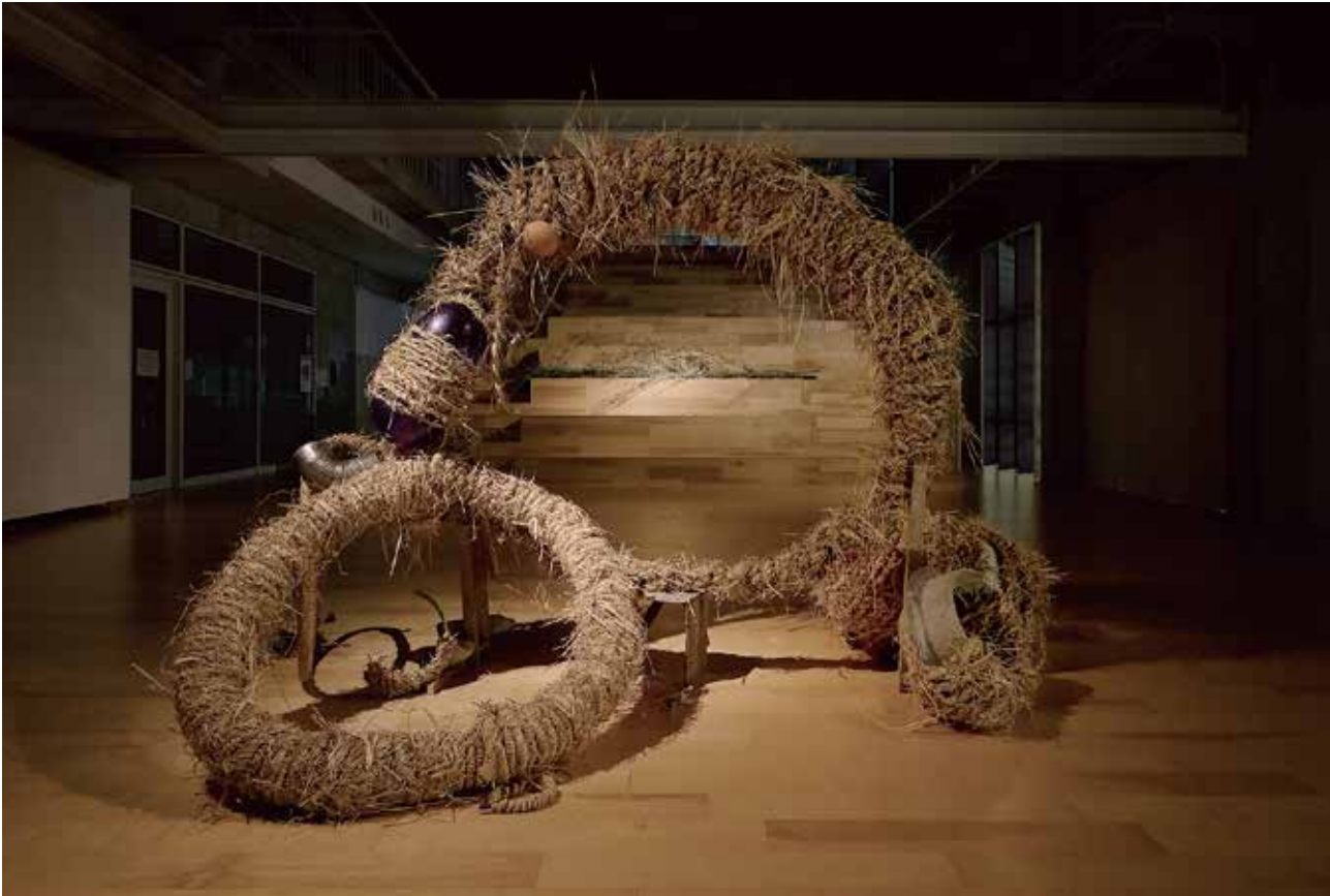
辻上碧 「葦見」 2024 藁、廃材、漂流物