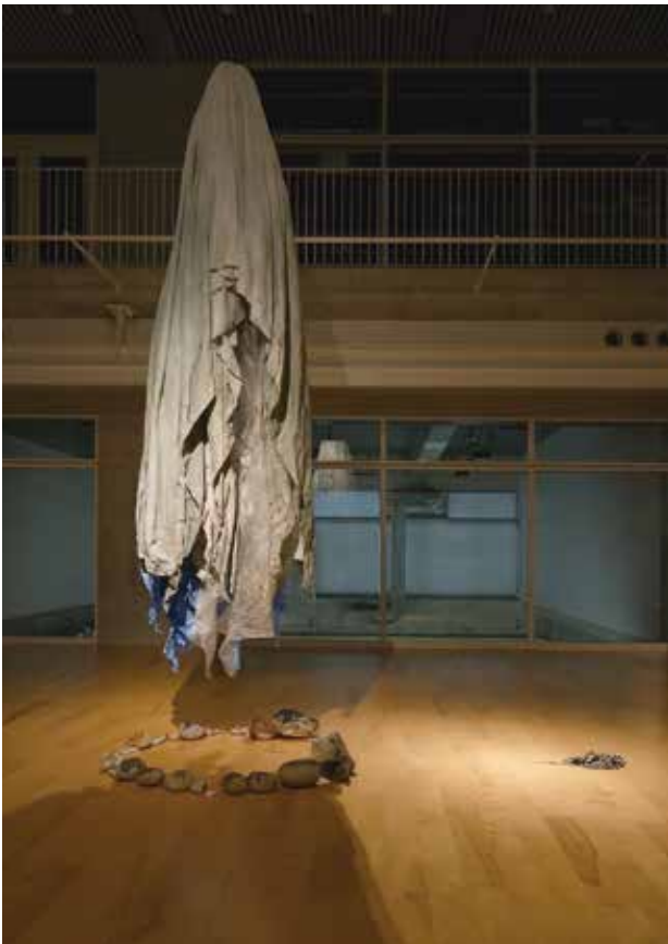
山田真音 「応えぬもの」 2024 布、石、風船、シャボン玉液、洗濯糊、ホウ砂、食塩、アクリル絵の具、ネイルリムーバー、ラッカースプレー、マニキュア、ビニールシート、ブルーシート、スライム