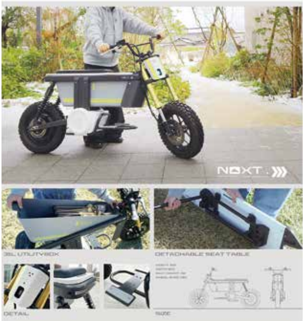
上野有輝 「NOXT」 バイクを使用した新たなアウトドアのライフスタイルの提案