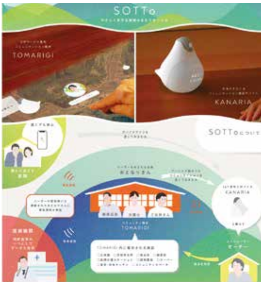
善佑伽 過疎地域における医療問題の解決に向けたサービスの研究