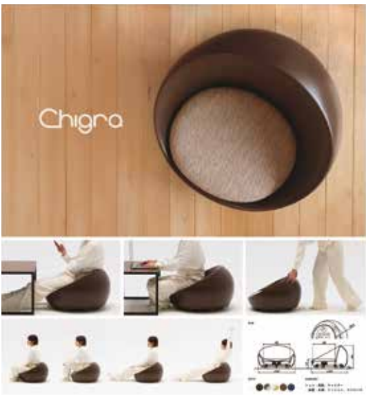
森島小紀瑛 「Chigra」 フロアライフを豊かにするロールチェア