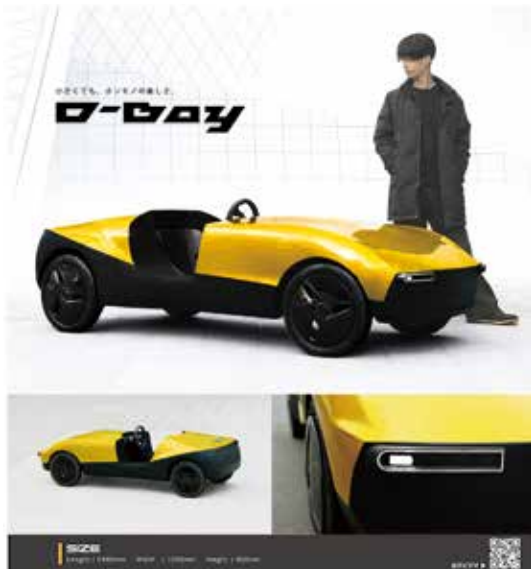
坪内大貴 「D-Boy」 運転する楽しさに特化したマイクロカー