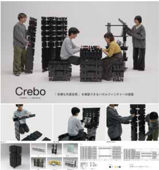
喜多純平 「Crebo」 多様な作業空間を構築できるパズルファニチャー